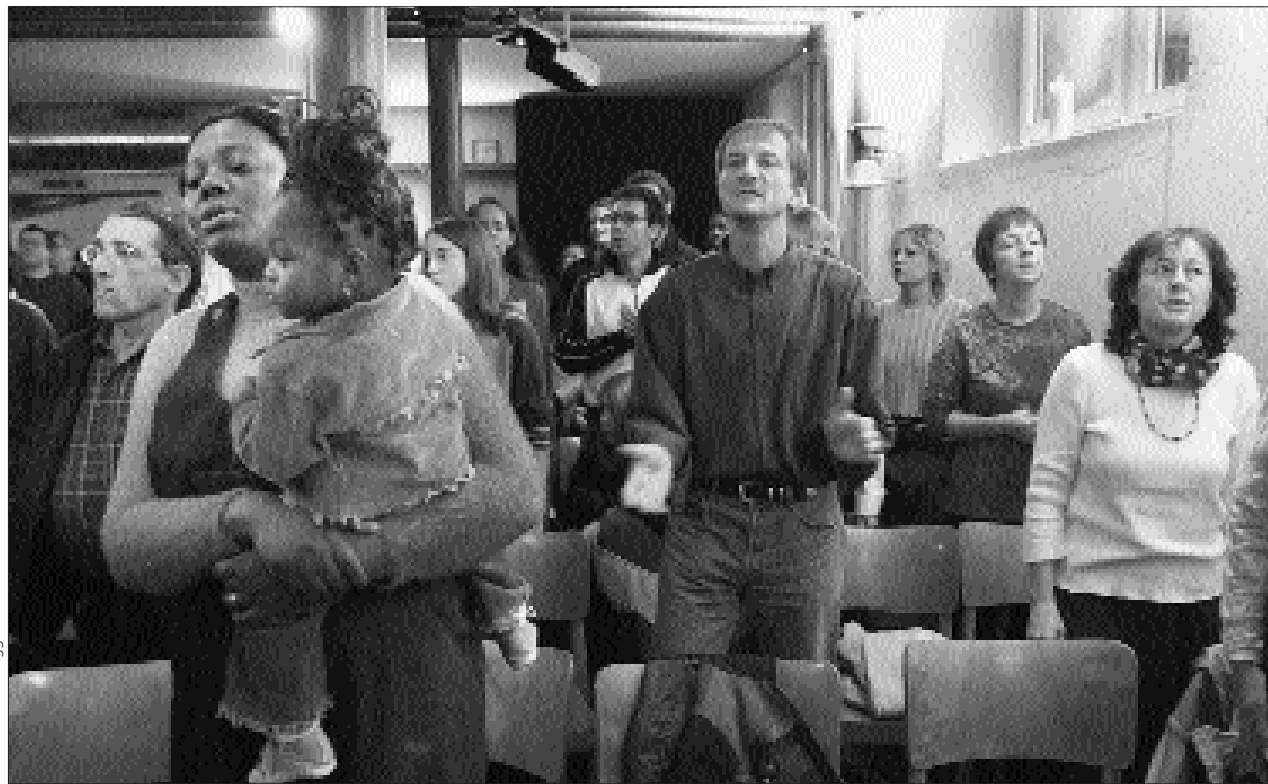
Eine Feier (mit AfrikanerInnen) im Soussol, die andere (im Hindutempel) am Rand der Stadt: Noch fristen Gottesdienste mit Menschen aus anderen Kulturen und Religionen ein Schattendasein

Vertrauensbildende Massnahmen haben sich bewährt. Seit zehn Jahren richtet der Reformierte Synodalrat den andern Religionen zu deren grossen Festen ihre Segenswünsche aus, und diese erwidern sie. In der letzten Legislatur hat der Imam